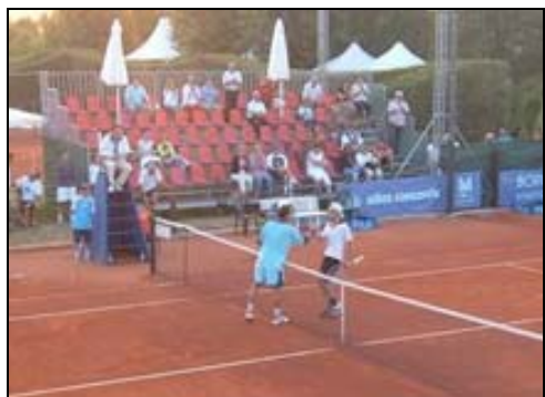
Aldi e Fraile a Sassuolo

Marach, dopo aver quindi usufruito in ben due occasioni del ritiro dell'avversario, ha poi conquistato l'accesso in finale superando Roitman al termine di un match molto tirato concluso per 6-3 al terzo set.