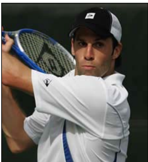
Greg Rusedski, primo favorito a Surbiton.

Come tradizione la stagione sull'erba è iniziata nel sobborgo londinese di Surbiton dove si è disputato il Surbiton Trophy (50000 $ + H) . All'avvio del torneo londinese erano presenti molti dei migliori specialisti del tennis su erba guidati dall'inglese Greg Rusedski, n.º 31 del mondo, e dal croato Ivo Karlovic, n.º 77.