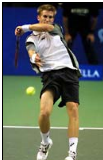
Jarkko Nieminen, vincitore dei Czech Open