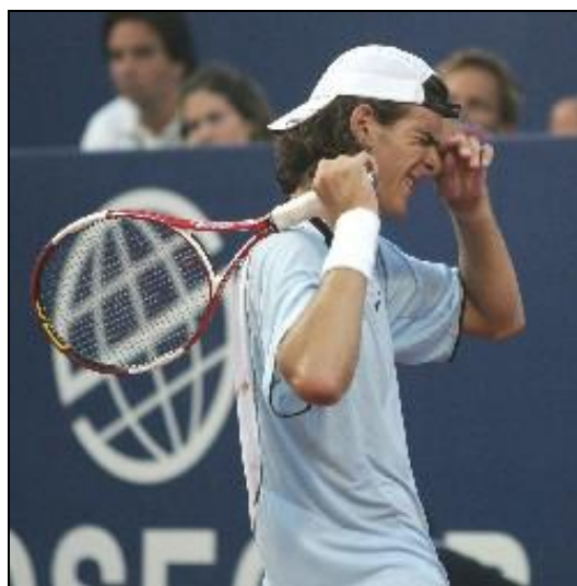
Una curiosa immagine di Del Potro