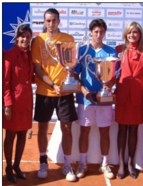
La premiazione dei finalisti