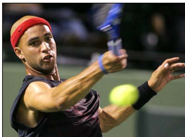
James Blake (ex n.° 22 ATP) vincitore a Tunica

Nella parte bassa del tabellone l'avversario in semifinale di Vahaly è stato invece James Blake. L'ex n.° 22 del mondo, precipitato in classifica intorno alla 200° posizione a causa di un infortunio patito lo scorso anno dopo il torneo di Roma e che lo ha tenuto fermo per tutta la stagione, è tornato alle gare ad inizio anno con buoni risultati (quarti di finale negli ATP Tour di Houston e Scottsdale).