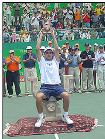
Alves incoronato vincitore sul trono Inca

Primo successo della carriera quindi per Alves e best ranking alla posizione n.º 170 della classifica ATP.