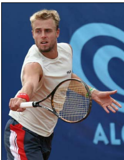
Un rovescio di Oliver Marach

Il francese ha poi servito per il set sul 5-4, ma qui Berlocq è riuscito a recuperare il break di svantaggio grazie a ripetute discese a rete alternate a difficilissimi passanti.